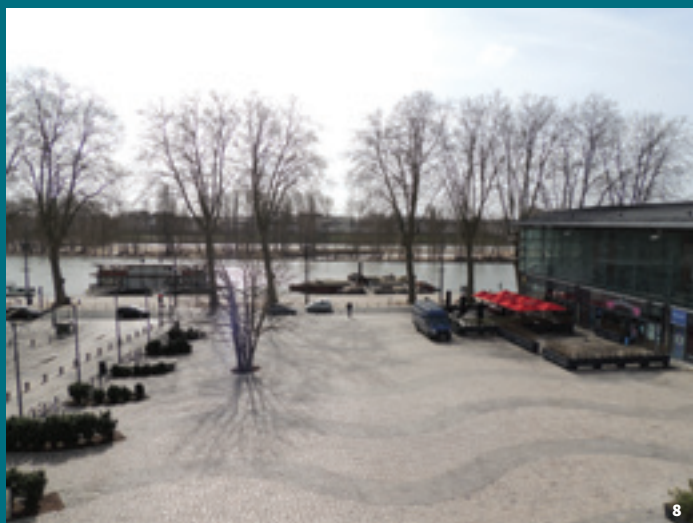
8. Place de Loire , 2001.